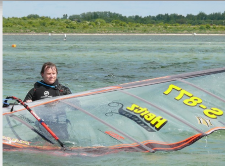
BQ blev tia.