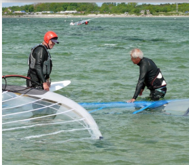
Lbj blev 11:a Putte blev 8:a